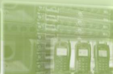
Redes Trunking TETRA y PMR