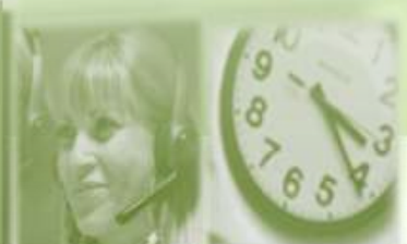
Gestión Agendas Cita Previa