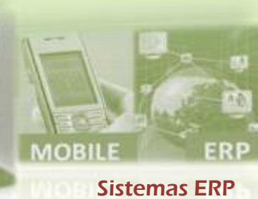
MOBILE ERP TC Mobile