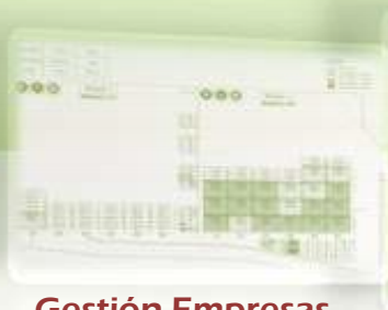
Gestión Empresas Estibadoras