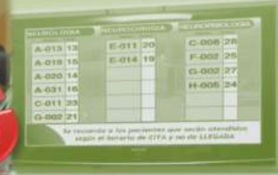
Gestión de Esperas Gestión de Identidades