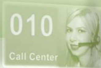
010. Call Center Telemarketing