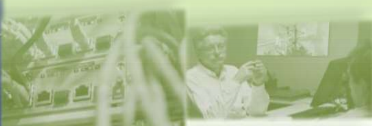
Consultoría de Telecomunicaciones