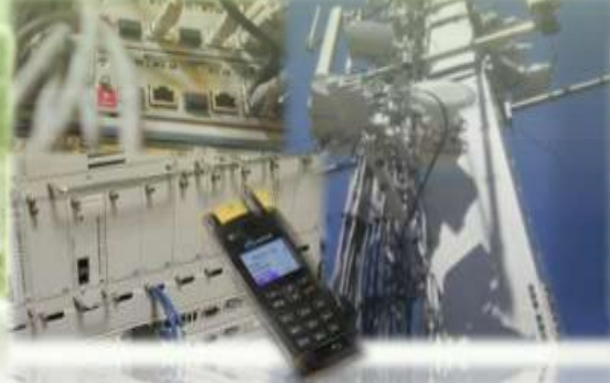
INFRAESTRUCTURA Y TELECOMUNICACIONES