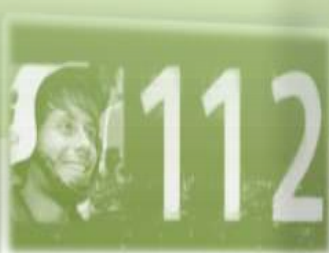
Centros de Control de Seguridad y Emergencias